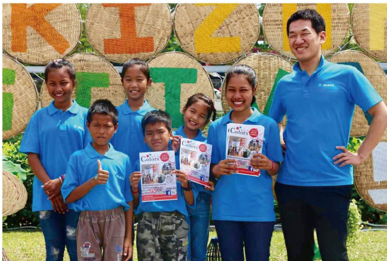
カンボジア プノンペン・日本カンボジア絆フェスティバルにて